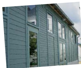
Salle des associations La Celle-en-Morvan (Saône-et-Loire)