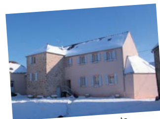
Réhabilitation de logements La Roche-en-Brenil (Côte-d'Or)